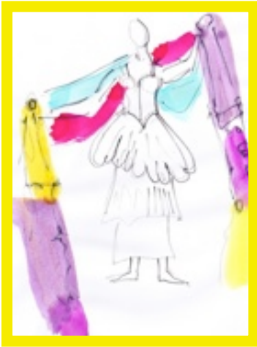
La grande écharpe de la chanteuse