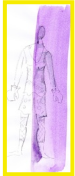
Costume de Walkyrie pour le final